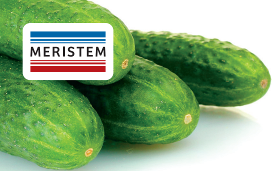
Схема удобрения: ОГУРЦА